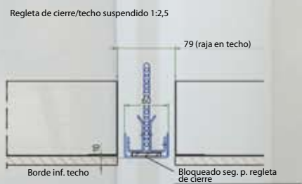
Regleta de cierre