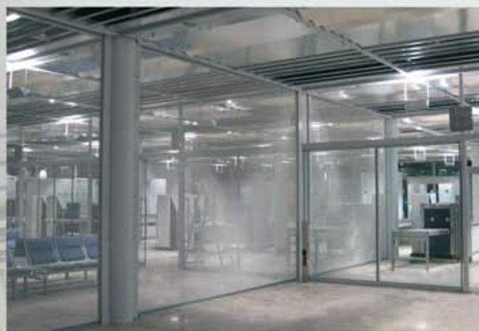
Diferentes diseños de la tela metálica