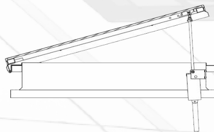
PETA.COIF AIR - Versão Eléctrica

PETA.COIF AIR é uma clarabóia de simples comporta, com abertura para ventilação natural.